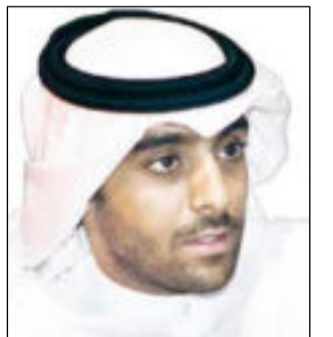
بقلم ضاري الوزان *