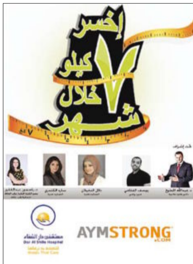
الإعلان الخاص بمشروع «اخسر 7 كيلو»