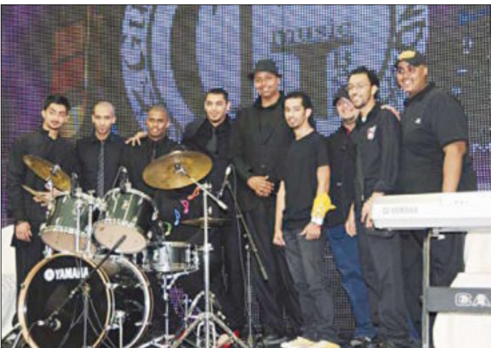
اعضاء فرقة مسرح الخليج