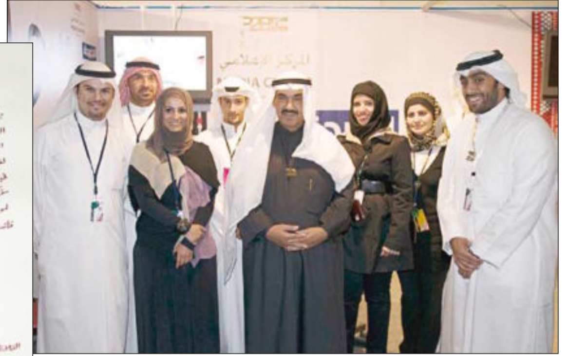
سمو الشيخ ناصر الحمد الصباح يتوسط اعضاء المركز الاعلامي لـ «كويتي وأفتخر»