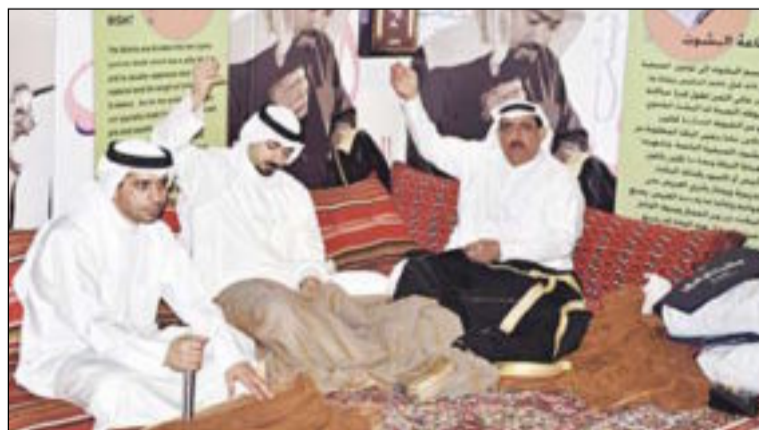
حياكة البشوت كانت حاضرة في «كويتي وأفتخر»