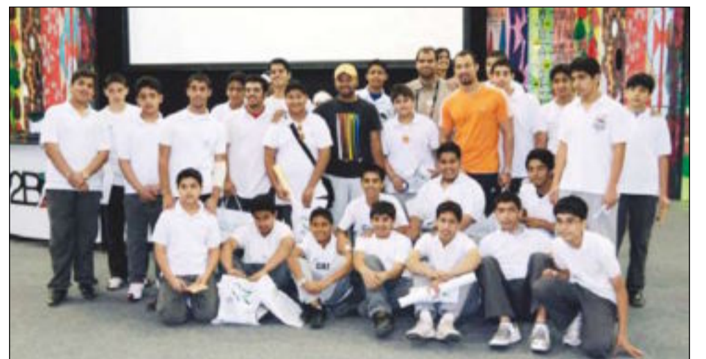
طلاب في زيارة للملتقى